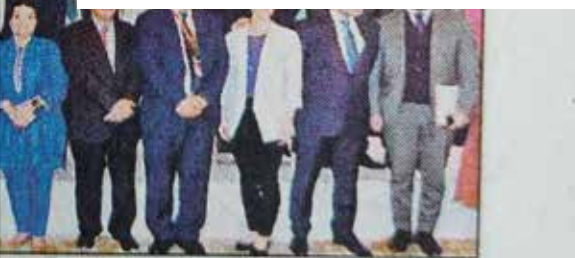
اعلیٰ تعلیم کے فروغ پر تین روزہ کانفرنس کے

اسلام آباد (خصوصی رپورٹر) امریکی تعاون سے پاکستان میں اعلیٰ تعلیم کے فروغ کے موضوع پر تین روزہ کانفرنس اختتام پذیر ہو گئی، کانفرنس کا انعقاد ہائر ایجوکیشن سسٹم سٹرینتھنگ ایکٹیوٹی (ایچ ای ایس ایس اے) کے تحت کیا گیا تھا جبکہ اس کیلئے اعانت یو ایس ایڈ کے تعاون سے فراہم کی گئی، کانفرنس سے خطاب کرتے ہوئے وفاقی وزیر تعلیم رانا تنویر حسین نے پاکستان کے اعلیٰ تعلیمی نظام کو قومی ضروریات، بدلتے ہوئے سماجی اور اقتصادی منظر نامے کے مطابق بنانے کی اہمیت پر زور دیا، کانفرنس میں شرکاء سے بات کرنے کے لئے مختلف شعبہ جات کے تقریباً چالیس قومی اور بین الاقوامی ماہرین کو اکٹھا کیا گیا، کانفرنس کی اختتامی تقریب سے ایچ ای ایس کی ایگزیکٹو ڈائریکٹر ڈاکٹر شائستہ سہیل اور یو ایس ایڈ کے مشن ڈائریکٹر (Reed Aeschliman) نے بھی خطاب کیا۔