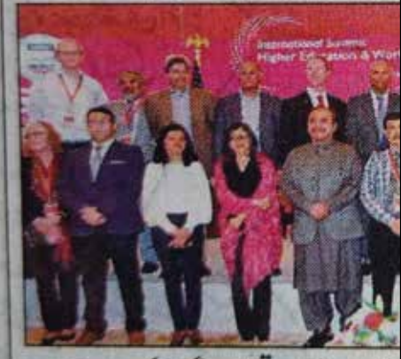
تمام وفاقی وزیر تعلیم و دیگر کارپورٹس

وریات، بدلتے ہوئے سماجی او کے مطابق بنانے کی ضرورت ہے، ایچ ای سی کی ایگزیکٹو ڈائریکٹر ڈاکٹر شائستہ سمیل نے کہا کہ کانفرنس میں افرادی قوت (باقی صفحہ 5 نمبر 30)