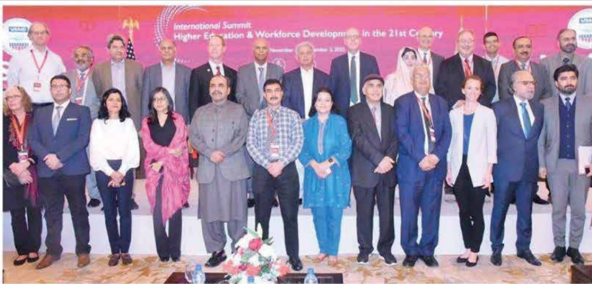
Minister of Federal Education and Professional Training Rana Tanveer Hussain and US senator of Utah Keith Grover with others at closing session.