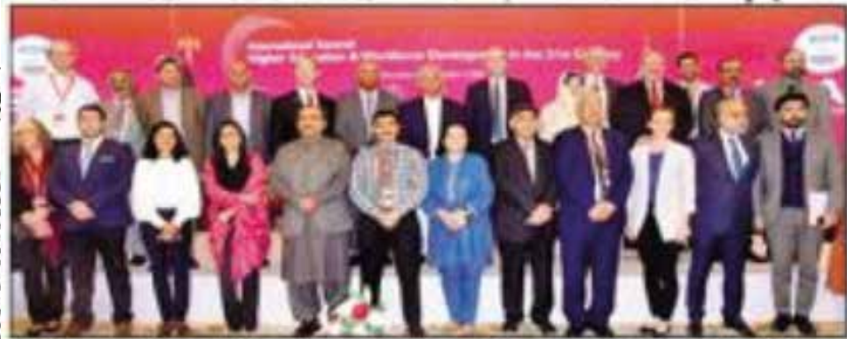
اعلیٰ تعلیم کے فروغ پر تین روزہ کانفرنس کے اختتام وفاقی وزیر تعلیم و دیگر کارپورٹس

اسلام آباد (خبرنگار خصوصی) پاکستان میں اعلیٰ تعلیم کے فروغ کے موضوع پر تین روزہ کانفرنس اختتام پذیر ہو گئی، وفاقی وزیر تعلیم رانا تنویر حسین کا کہنا ہے پاکستان کے اعلیٰ تعلیمی نظام کو قومی ضروریات، بدلتے ہوئے سماجی اور اقتصادی منظر نامے کے مطابق بنانے کی ضرورت ہے، ایچ ای سی کی ایگزیکٹو ڈائریکٹر ڈاکٹر شائستہ سمیل نے کہا کہ کانفرنس میں افرادی قوت (باقی صفحہ 5 نمبر 30)