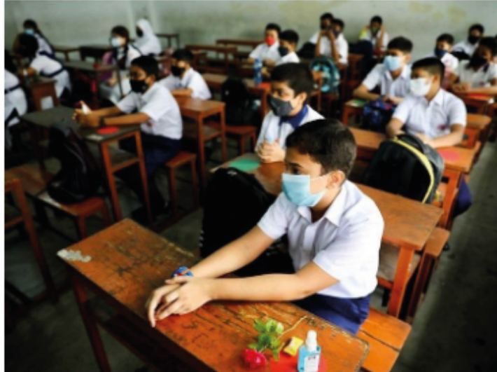
Students attend a class after the government withdrew restrictions on educational institutions following a decrease in the number of cases of coronavirus disease (Covid-19) in Dhaka, Bangladesh, September 22, 2021.

Speakers at an international summit on higher education Friday emphasised the need to align Pakistan's higher education sector with emerging needs and trends in an ever-changing socio-economic landscape.