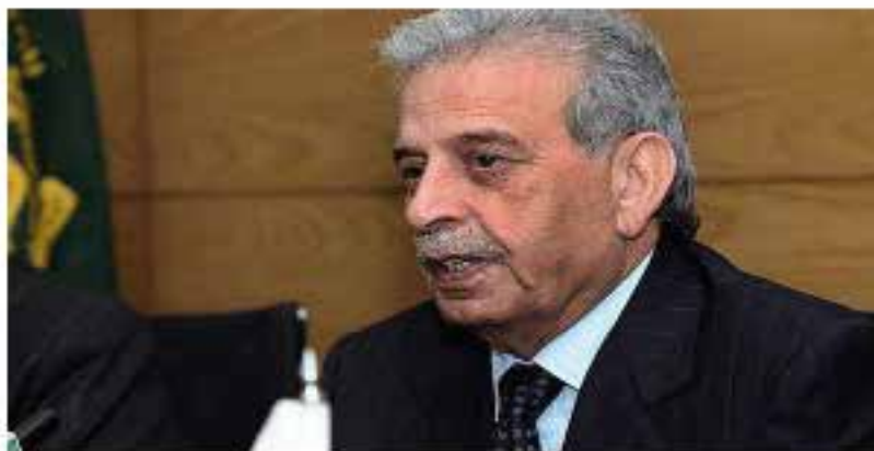
Rana Tarveer Hussain

ISLAMABAD, Dec 3 (APP): Federal Minister for Education and Professional Training Rana Tarveer Hussain Saturday said that the modernization of the higher education system is the key to the country's progress and prosperity and the government was taking result-oriented steps for improving the education system.