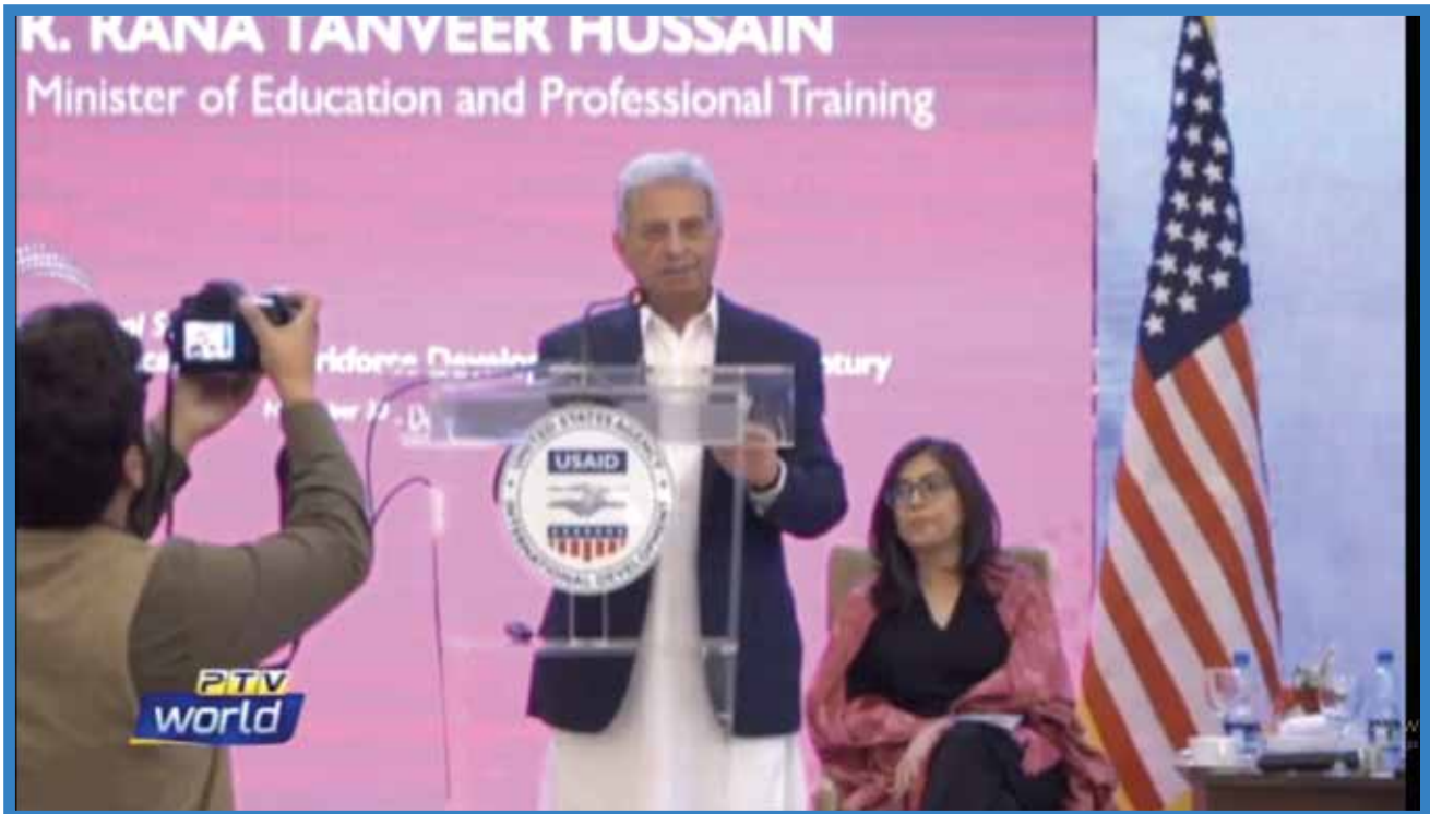
AT 09:00 PM News