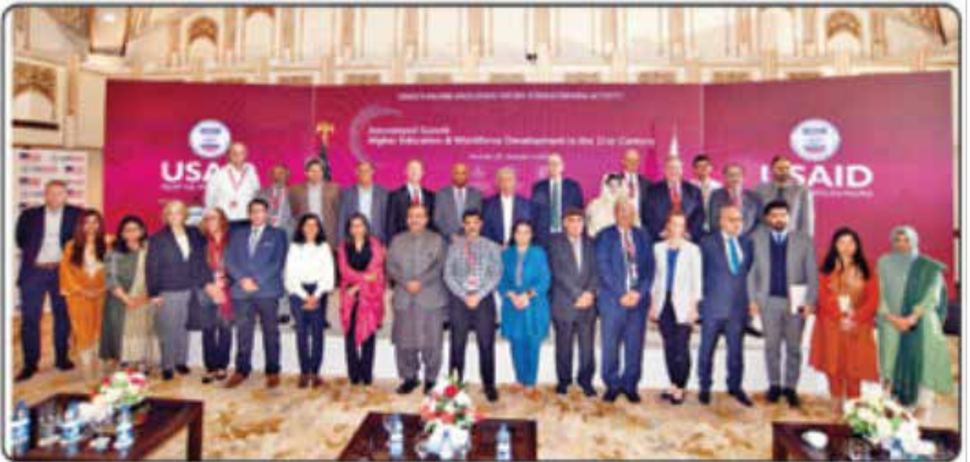
اسلام آباد: یو ایس ایڈ کے تعاون سے اعلیٰ تعلیم کے فروغ کے موضوع پر تین روزہ کانفرنس کی اختتامی تقریب میں وفاقی وزیر تعلیم رانا تنویر کے ساتھ شرکاء کا گروپ فوٹو

اسلام آباد (نئی بات نیوز) امریکی تعاون سے پاکستان میں اعلیٰ تعلیم کے فروغ کے موضوع پر تین روزہ کانفرنس اختتام پذیر ہو گئی۔ اس کانفرنس کا انعقاد ہائر ایجوکیشن سسٹمز اسٹریٹجک ایلیمنٹی (ایچ ای ایس ایس اے) کے تحت کیا گیا تھا جبکہ اس کیلئے اعانت امریکی ادارہ آئی بی این اقوامی ترقی (یو ایس ایڈ) کے تعاون سے فراہم کی گئی۔ کانفرنس سے خطاب کرتے ہوئے وفاقی وزیر تعلیم رانا تنویر حسین نے پاکستان کے اعلیٰ تعلیمی نظام کو قومی ضروریات، بدلتے ہوئے سماجی اور اقتصادی منظر نامے کے مطابق بنانے کی اہمیت پر زور دیا۔ اس کانفرنس میں شرکاء سے بات کرنے کیلئے مختلف شعبہ جات کے تقریباً چالیس قومی اور بین الاقوامی ماہرین کو اکٹھا کیا گیا۔ ماہرین کا کہنا تھا یہ کانفرنس پاکستان میں اعلیٰ تعلیمی پالیسی سازی کے عمل کو توجیہ دینے کے لیے ایک سنگ میل ثابت ہوگی۔ کانفرنس کی اختتامی تقریب سے خطاب کرتے ہوئے ایچ ای ایس ای کی ایگزیکٹو ڈائریکٹر ڈاکٹر شائستہ سمیل نے کہا کہ اس کانفرنس میں افزائی قوت کی قابلیت کو بہتر بنانے کیلئے مفید سفارشات پیش کی گئی ہیں جنہیں ایچ ای ایس ای اپنی آئندہ کی منصوبہ بندی اور جاری اقدامات کے ساتھ ہم آہنگ کرنے کا ہاتھ دیا گیا۔