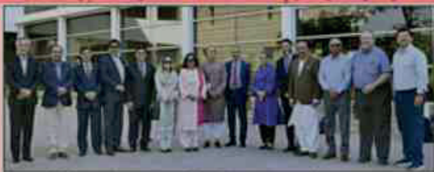
اسلام آباد و پاکستانی یونیورسٹیوں کے وائس چانسلرز کا جو ایس ایڈ کی ہائیر ایجوکیشن سسٹمز ٹھنڈک اکیڈمی نئی دہلی کے تحت مشورتی میٹنگ کے بعد گروپ فوٹو