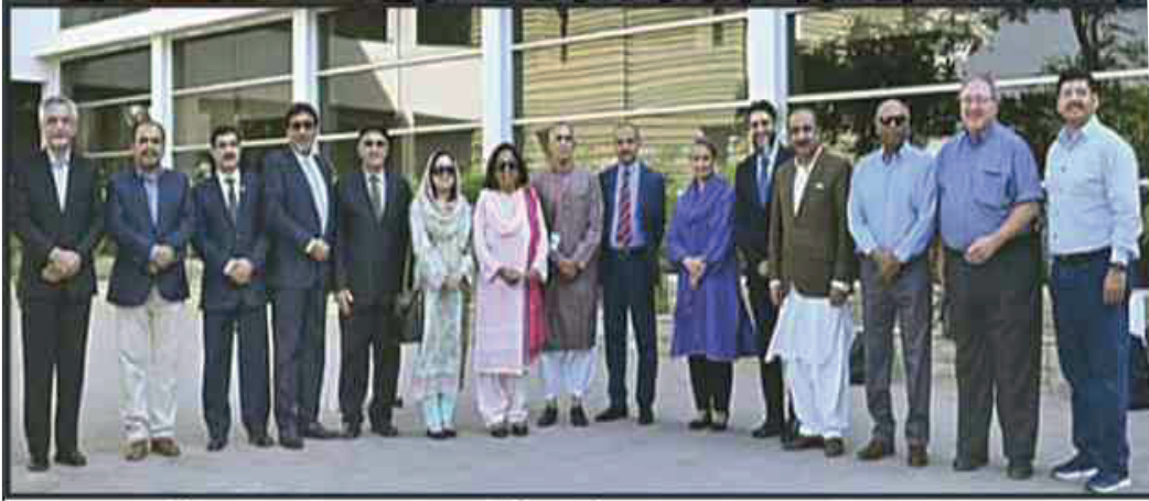
اسلام آباد: پاکستانی یونیورسٹیوں کے وائس چانسلرز کا یو ایس ایڈ کی ہائر ایجوکیشن سسٹم سٹرٹجیٹک ایکٹیویٹی کے تحت مشاورتی میٹنگ کے بعد گروپ فوٹو