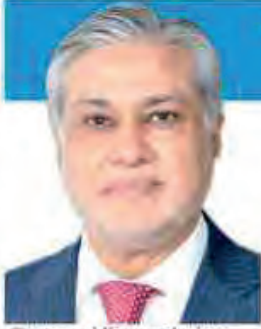
Govt providing conducive environment to investors: Dar -Page 06

www.pakobserver.net f pakobserver i pakobserver Pakistan observer t pakobserver