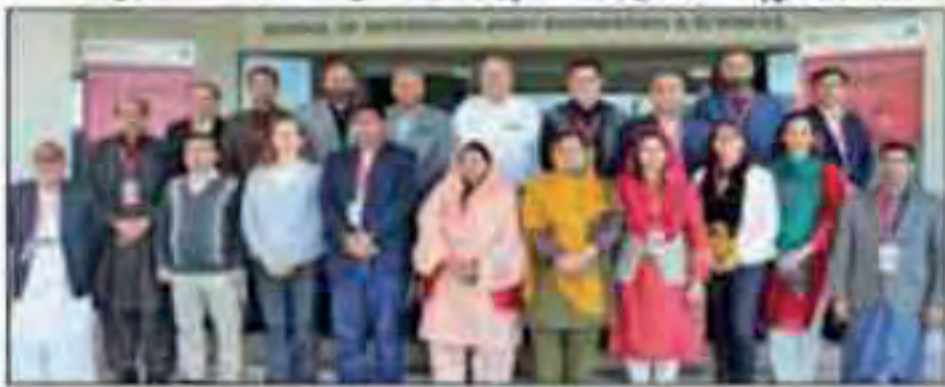
ایپارٹمنٹ چیئرمین کے لیے سٹرٹیجک پلاننگ پر دو روزہ ورکشاپ پر شرکاء کا گروپ فوٹو