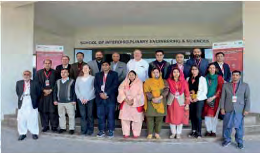
اسلام آباد۔ پبلک سیکلر یونیورسٹیوں میں شعبہ جاتی سربراہان کیلئے منعقدہ تربیتی ورکشاپ کے شرکاء کا گروپ فوٹو