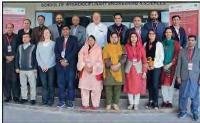
(USAID) کی باہر ایجوکیشن سسٹم سٹریٹجک ایکٹیوٹی (Hessa) کے شرکاء کا گروپ فوٹو

کے ماحول کو بہتر بنانے کے حوالے سے بھی تربیت حاصل کی۔ مزید برآں، اس توسیعی تربیت کی تکمیل اور پینل فورمز اور 2023ء میں امریکہ کے ایک مطالعاتی دورے سے کی جائے گی۔ Hessa کے نفاذ کی حکمت عملی یونیورسٹی انتظامیہ کی بہتری کے لیے ٹریژر کو تیار کرنے کی کوشش کرتی ہے جو اپنی شعبہ جاتی حدود سے آگے بڑھنا چاہتے ہیں اور اپنی متعلقہ یونیورسٹیوں میں ترقی کی راہیں ہموار کرنا چاہتے ہیں۔ Hessa ایک پانچ سالہ USAID کی 19 ملین ڈالرز کی مالی اعانت سے چلنے والا پروگرام ہے جس کا مقصد اعلیٰ تعلیم میں پائیدار اصلاحات متعارف کرانا اور پاکستانی یونیورسٹیوں کے ساتھ تدریس، تحقیق، طلبہ کی معاونت، نیز گورننس میں بین الاقوامی بہترین پالیسیوں پر کام کرنا ہے۔