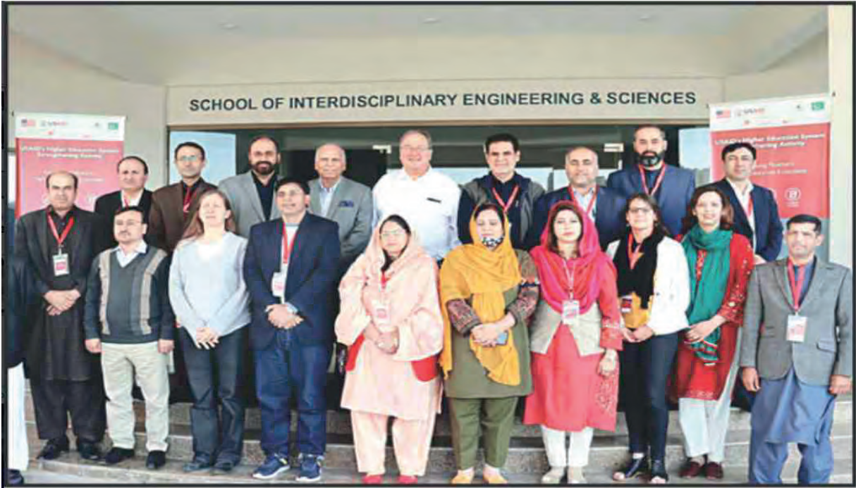
یو ایس ایڈ کے زیر اہتمام سرکاری جامعات میں سٹریٹجک پلاننگ ورکشاپ کے شرکا کا گروپ فوٹو