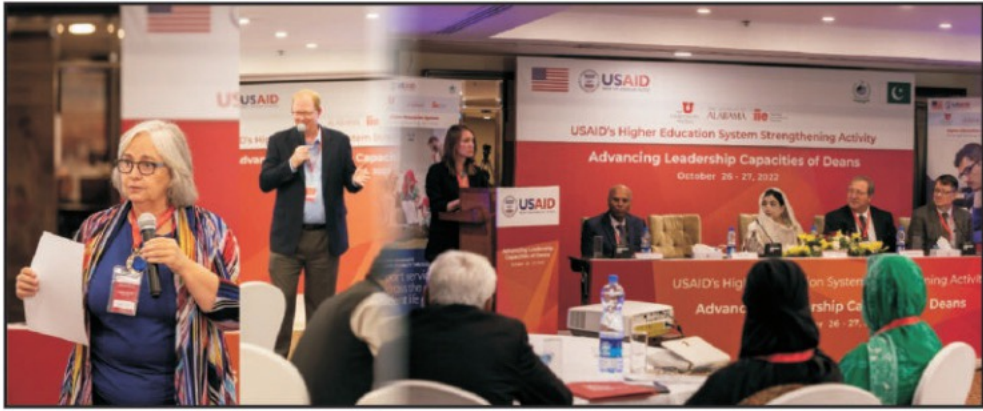
پبلک سیکٹر کی جامعات کے ڈینز یو ایس ایڈ کے تعاون سے منعقدہ پروگرام میں جدید طرز تعلیم سے متعلق معلومات حاصل کر رہے ہیں

راستہ فراہم کیا اور جامعات میں ایک موثر قیادت کو فروغ دیا۔ مزید برآں، اس 2 روزہ تربیتی پروگرام کے بعد آن لائن سیشنوں ہوں گے جہاں ڈینز طلبہ کی کامیابی کو یقینی بنانے اور نتائج کو موثر بنانے کے لیے اسٹریٹجک منصوبے تیار کریں گے۔ (HESSA) ایک پانچ سالہ، 19 ملین ڈالر کی، USAID کی مالی اعانت سے چلنے والا پروگرام ہے جو پاکستان میں پائیدار اعلیٰ تعلیم کی اصلاحات متعارف کرانے کے لیے سٹیج ہولڈرز کو شامل کر کے سرکاری جامعات کی صلاحیتوں کو بہتر بنانا چاہتا ہے۔ جامعات کے ساتھ تعلیم، تحقیق اور قیادت کے بین الاقوامی طریقوں پر کام کرنے کے علاوہ، ایچ ای ایس ایس اے کے کمپس میں طلبہ کے لیے دستیاب معاون سہولیات کو بڑھانے کی کوشش بھی کرتا ہے۔