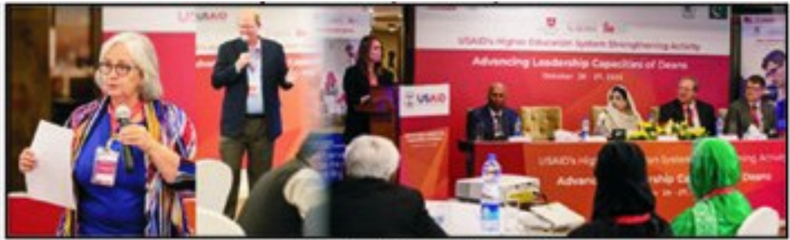
پبلک سیکٹریونیورسٹیوں کے ڈینز کے لیے یو ایس ایڈ پروگرام کا انعقاد۔

کی ایگزیکٹو ڈائریکٹر ڈاکٹر شائستہ سہیل نے شرکت کی۔ اس موقع پر خطاب کرتے ہوئے ڈاکٹر شائستہ نے اعلیٰ تعلیم میں سرمایہ کاری کی اہمیت پر زور دیا اور پاکستان کی اقتصادی ترقی کیلئے یو ایس ایڈ کے عزم کو سراہا۔ انہوں نے کہا کہ پاکستان بھر میں تمام مذہبی شعبوں اور سرکاری تنظیموں کے معیار کو بھر پور بنانے کیلئے ہمیں تعلیم کے شعبے اور خاص طور پر اعلیٰ تعلیم میں مزید سرمایہ کاری کرنے کی ضرورت ہے۔ ان کا کہنا تھا کہ اعلیٰ تعلیمی نظام کو مضبوط بنا کر ہم تمام متعلقہ شعبوں میں مہارت اور قیادت کا ایک کیڈر تیار کر سکتے ہیں۔ نیز مختلف شعبہ جات کی موثر طریقے سے رجسٹریشن کرنے کیلئے یونیورسٹی کے ڈینز کے پاس حکمت عملی ہونی چاہیے۔