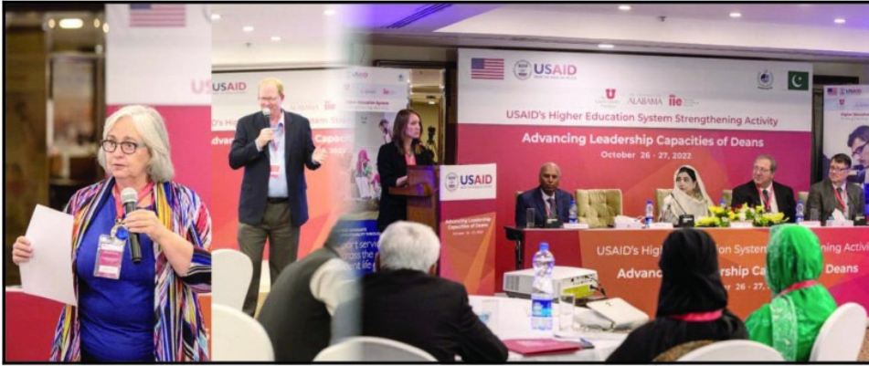
پبلک سیکٹر یونیورسٹیوں کے ڈینز کیلئے یو ایس ایڈ کے تربیتی پروگرام کا انعقاد کیا جا رہا ہے