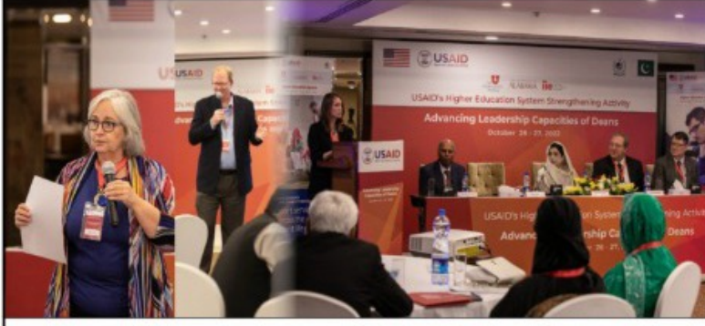
پبلک سیکرٹری یونیورسٹیوں کے ڈائریکٹرز کے لیے یو ایس ایڈ کے تربیتی پروگرام کا انعقاد