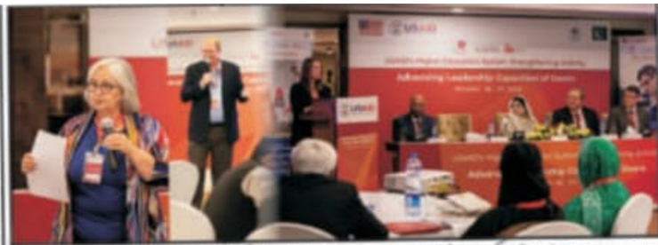
اسلام آباد پبلک سیکلر یونیورسٹیوں کے لیے دوروزہ ٹریننگ کا انعقاد

49 (HESA) 16 اگست کو اسلام آباد میں منعقد کی جانے والی اس سال کی 16 (HESA) سالانہ اجلاس میں شرکت کرنے کے لیے پاکستان کی مختلف جامعات کی طالب علموں کی ایک وفد نے اسلام آباد میں ایک دوروزہ ٹریننگ کا انعقاد کیا۔ اس سال کی 16 (HESA) سالانہ اجلاس میں شرکت کرنے کے لیے پاکستان کی مختلف جامعات کی طالب علموں کی ایک وفد نے اسلام آباد میں ایک دوروزہ ٹریننگ کا انعقاد کیا۔ اس سال کی 16 (HESA) سالانہ اجلاس میں شرکت کرنے کے لیے پاکستان کی مختلف جامعات کی طالب علموں کی ایک وفد نے اسلام آباد میں ایک دوروزہ ٹریننگ کا انعقاد کیا۔