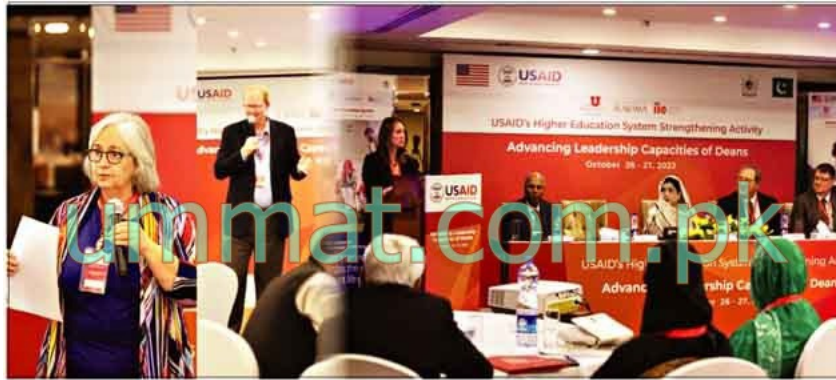
نجی یونیورسٹیوں کے ڈینز یو ایس ایڈ کے تربیتی پروگرام میں شریک ہیں