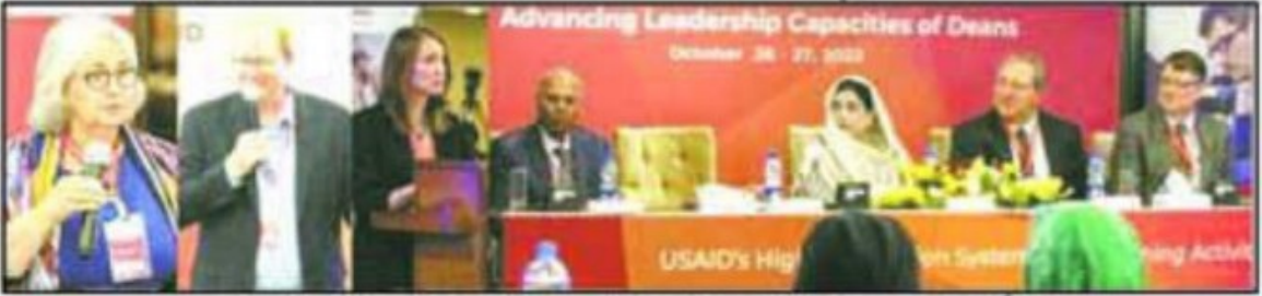
پبلک سیکلریو نیورسٹیوں کے ڈائریکٹرز کی تربیتی تقریب میں شرکاء اپنے خیالات کا اظہار کر رہے ہیں

49 ایڈیٹر تاکوان مذاہبوں کا فروغ کے ذریعے امتحان چیلنج یہ نیورسٹیوں کے لیے روزانہ چیلنج کا اظہار کیا گیا ہے میں ایسے کو 10 پاکستانی نیورسٹیوں کی سوانح سے لگایا گیا ہے