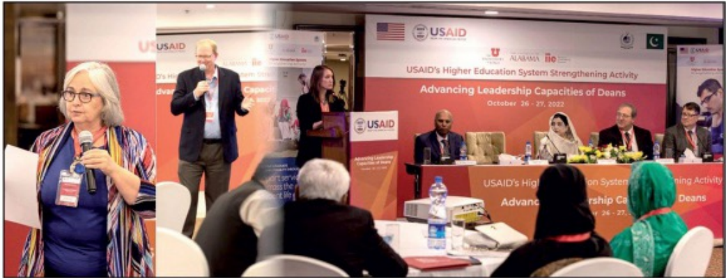
USAID Imparting leadership training to deans of public sector universities

ties of Deans 'for public sector universities. HESSA is being implemented in collaboration with 16 Pakistani universities with a focus on strengthening universities' capacity to deliver market-driven education and research to enhance graduate employability.